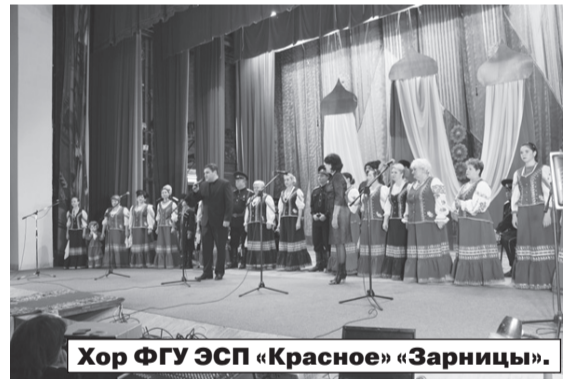
Хор ФГУ ЭСП «Красное» «Зарницы».

Выделяются средства на подписку газеты «Голос правды»: - пенсионерам предприятия, - работникам предприятия.